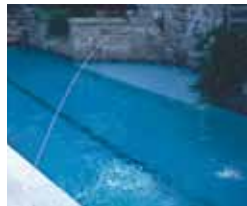
Un chorro de 1/4 pulgadas