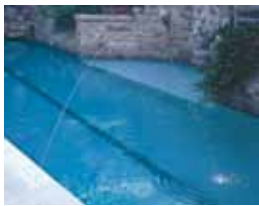
Un chorro de 3/16 pulgadas