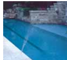
Rocío tipo abanico

Los primeros decorativos acuáticos fueron diseñados para aplicaciones comerciales y luego se adaptaron para el uso residencial. El resultado fue un diseño demasiado complejo y precios elevados. El efecto acuático Deck Jet de Pentair está específicamente diseñado para uso residencial, usando materiales de construcción y técnicas de fabricación que permiten menores costos. La construcción totalmente de plástico de las piezas clave reduce los costos iniciales y de toda la vida del sistema proporcionando operación libre de problemas con poco o nada de mantenimiento.