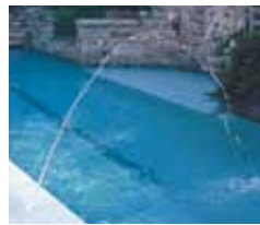
Un chorro de 5/16 pulgadas